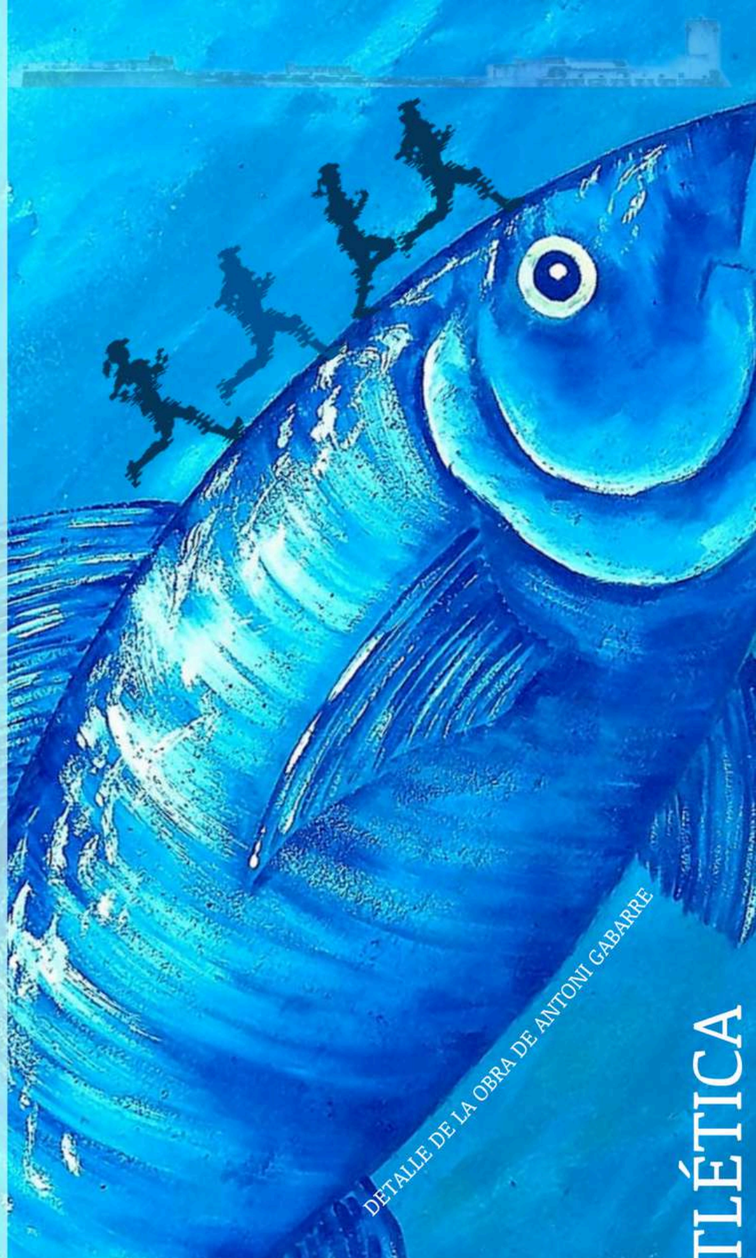
DETALLE DE LA OBRA DE ANTONI GABARRE